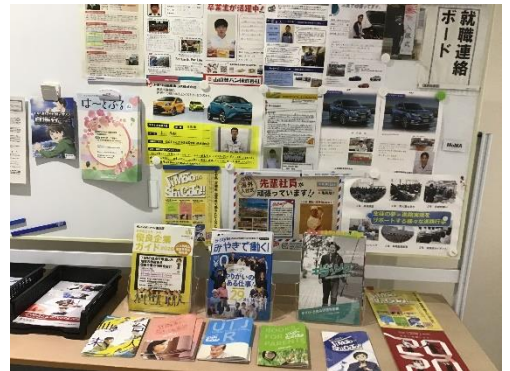
↑ 進路室前にも各種情報あり