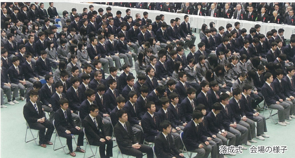
落成式 会場の様子