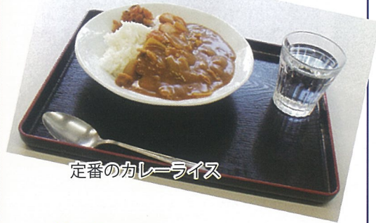
定番のカレーライス