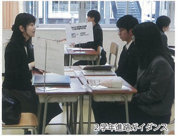
2学年進路ガイダンス