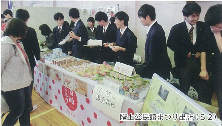
階上公民館まつり出店(S2)