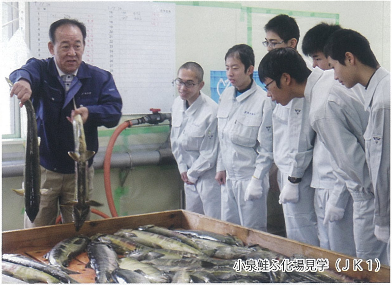
小泉鮭ふ化場見学 (JK1)