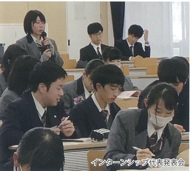
インターンシップ代表発表会