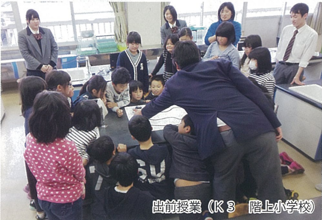
出前授業 (K3 階上小学校)