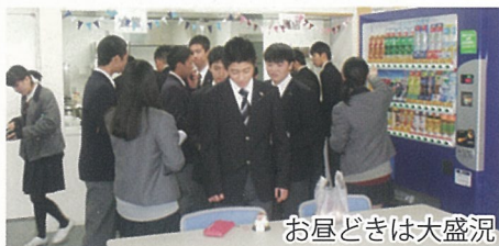
お昼どきは大盛況

本校職員には、多くの卒業生も在職しており、食堂が再開されたことで、「生徒時代に食べた味を懐かしいといってくれるので嬉しいです」と話されました。