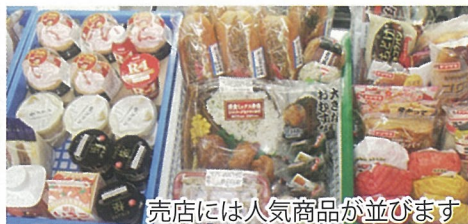
売店には人気商品が並びます