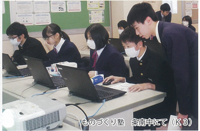
ものづくり塾 条南中にて (K3)