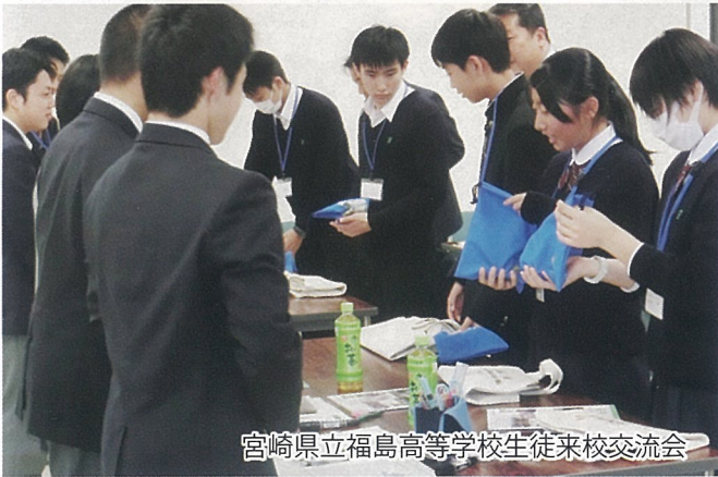
宮崎県立福島高等学校生徒来校交流会