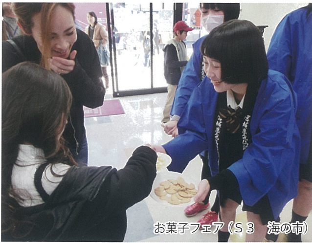
お菓子フェア (S3 海の市)