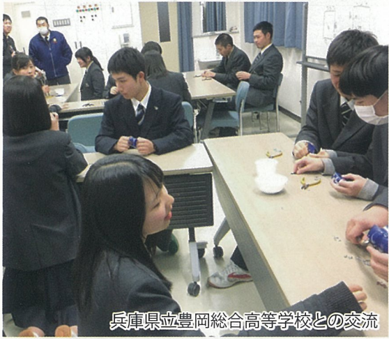
兵庫県立豊岡総合高等学校との交流