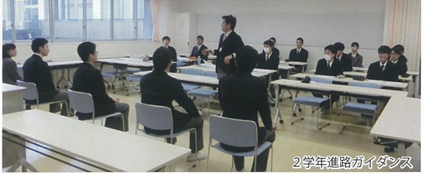
2学年進路ガイダンス