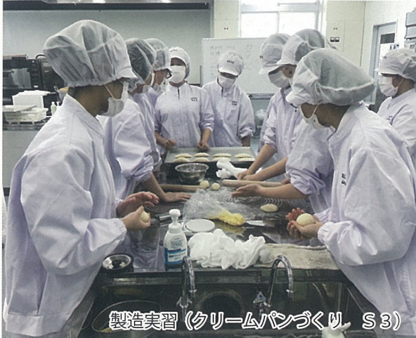
製造実習 (クリームパンづくり S3)