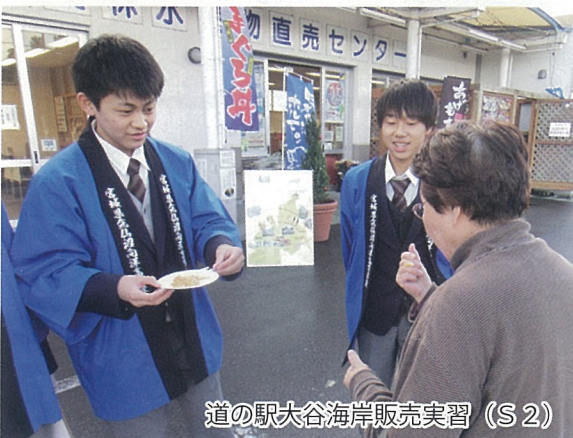
道の駅大谷海岸販売実習(S2)