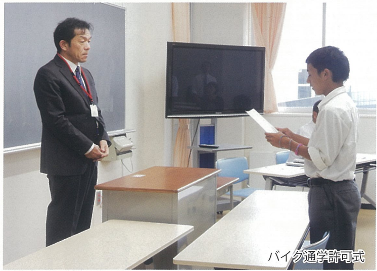
バイク通学許可式