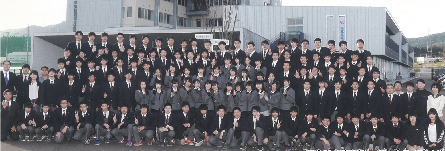
平成30年度卒業生

育て方を誤ったのかもしれない。私の子供二人はそれぞれ県外の大学に進学し、その後は宮城でも大学所在地でもない地域で生計を立てています。宮城に戻って来なかつたけれど、元気に暮らし自立できたのだから、それでよし、とすべきなのでしょう。二人の子供は、現在都内にそれぞれ居を構え、盆も正月もなく仕事に追われ、宮城に帰省することもまれでした。ところが、平成最後の年末年始に子供たちの帰省スケジュールが一日だけ合わせられ、十年ぶりに家族四人が揃って数時間を過ごす