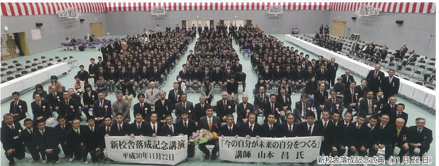
新校舎落成記念講演 平成30年11月22日