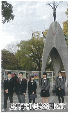
広島平和記念公園にて