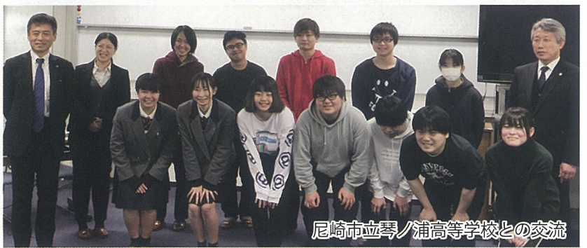
尼崎市立琴ノ浦高等学校との交流