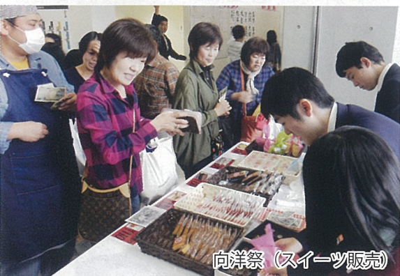
向洋祭(スイーツ販売)