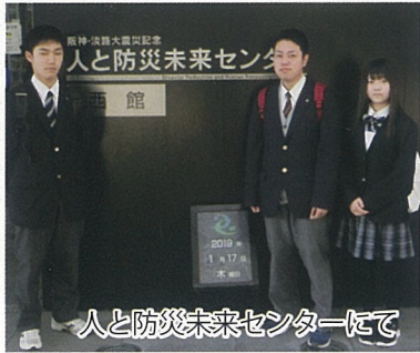
人と防災未来センターにて