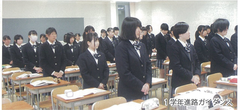
1学年進路ガイダンス