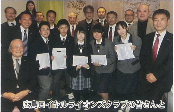
広島ロイヤルライオンズクラブの皆さんと