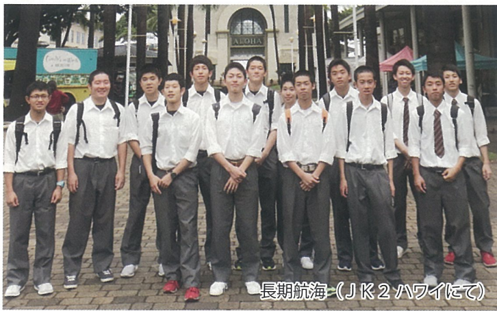
長期航海-(JK2 ハワイにて)