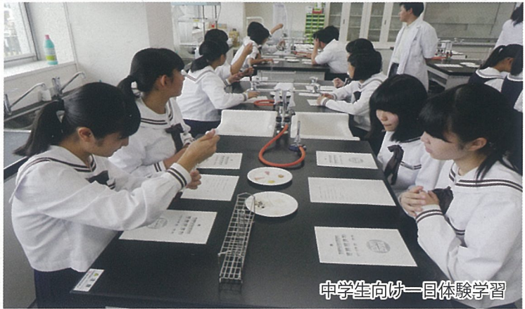
中学生向け一団体験学習