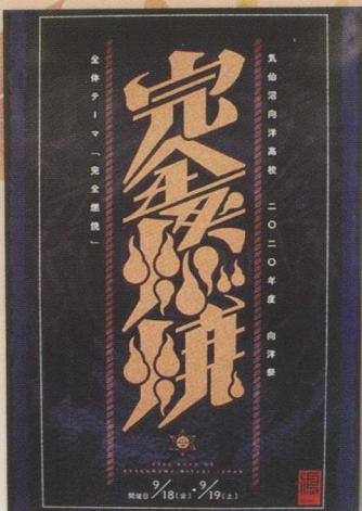
ポスター制作 (K2 川島樹)