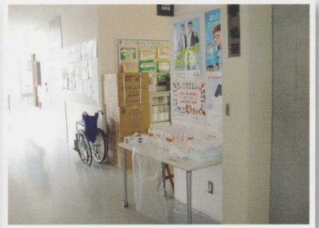
保健室脇に設置された消毒液セット