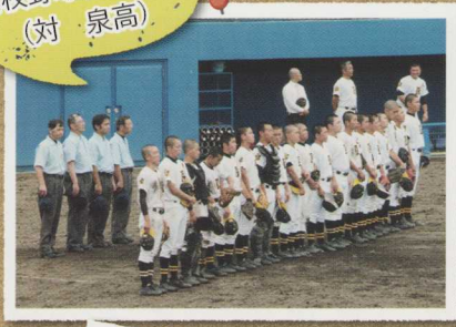
7月11日 高校野球代替試合 (対 泉高)