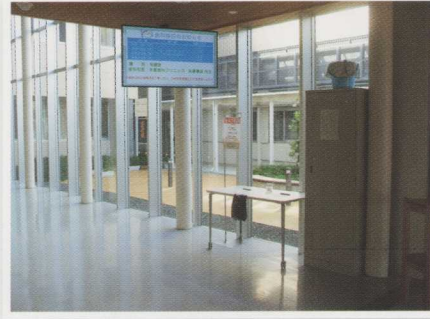
サイネージ付近に設置されたセルフ検温場