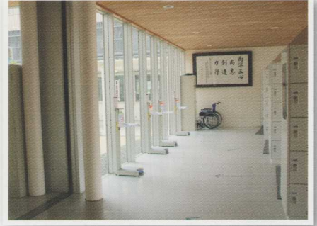
生徒昇降口に設置された消毒液