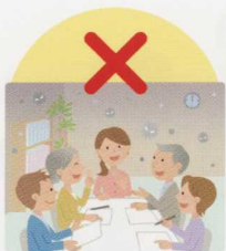
換気の悪い密閉空間