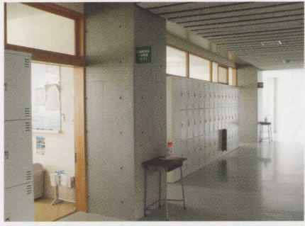
各教室入口に設置された消毒液