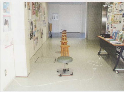
検診時におけるソーシャルディスタンス