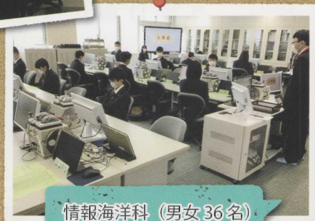
情報海洋科 (男女36名)