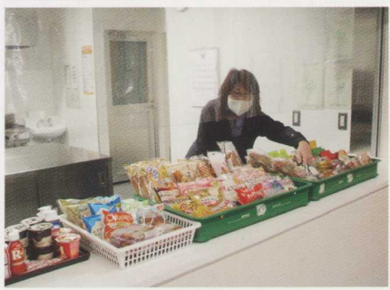
菓子パン・飲料のみの販売となった売店