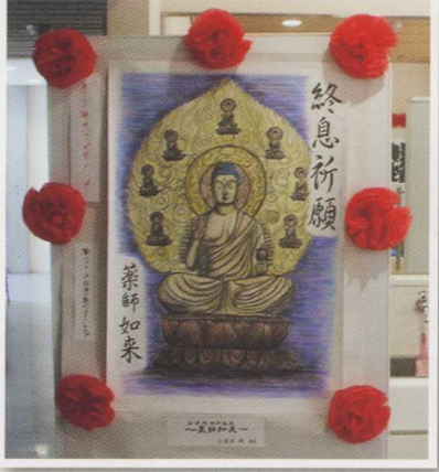
校長 荒木 順 画