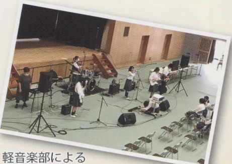
軽音楽部によるライブ演奏