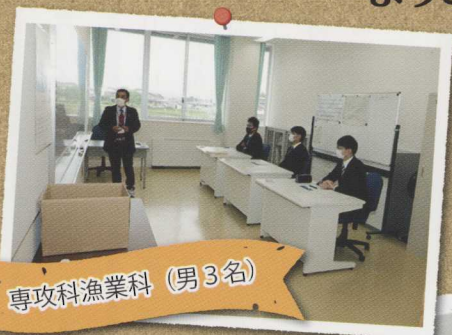
専攻科漁業科 (男3名)