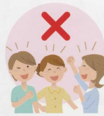
近距離での密接した会話