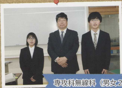
専攻科無線科 (男女2名)