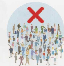
多くの人が密集する場所