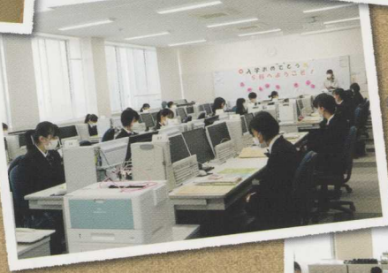
産業経済科 (男女40名)