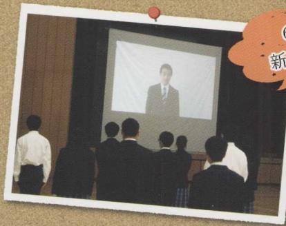
6月1日 新入生対面式