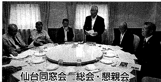
仙台同窓会 総会・懇親会