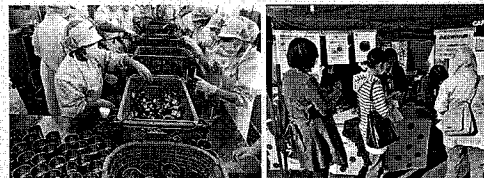
さんま缶詰製造実習

平成6年度の学科改編時に制定された制服が、今年度の3年生を持って終わりとなる。長年見続けていたものが変わっていくのは些が寂しい思いがする。そのような中でも「変わらないもの」がある。今年度、新工場で初めて伝統の「さんま味付け缶詰」を製造した。3年生の課題研究で開発した「うおかす燻」は第44回宮城県水産加工品研究団体連合会長賞を受賞した。酒がすミルクスイーツも5年目を迎えた。改めて地域に支えられている喜びを感じる。