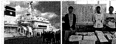
海上保安庁(まつしま)見学

牧通りの新校舎に移転して1年が過ぎました。施設設備としては他県に類を見ない程に充実したものとなりました。この新しい環境をフルに活用して、社会に貢献できる卒業生を一人でも多く輩出するために日々の教育活動に邁進して参ります。先輩方よりの有形、無形のご支援、お力添えをいただいで今日に至っていること、感謝申し上げます。