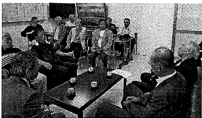
久しぶり集まった同級生との歓談の様子(校長室)

7月19日(金)気仙沼ホテル観洋にて総会及び懇親会が同窓生50名が集まり行われました。今回の担当は相撲部OB会でした。お世話いただいた相撲部の先輩方の熱い応援のもと楽しいアトラクションや踊りで、校長先生をはじめとした来賓の皆様をあたかくおもてなしいただきました。その場で次回担当は、ヨット部へと引き継がれました。