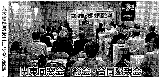
関東同窓会 総会・合同懇親会