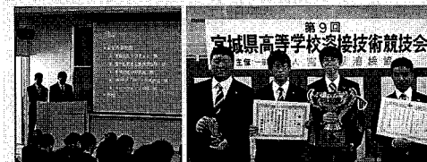
インターンシップ発表会

同窓会の皆様には、各所で多くの技術指導をいただき誠に感謝申し上げます。機械技術科で取り組む「みやぎクラフトマン事業(長期インターンシップ、資格取得支援、競技大会技術指導等)」では、多くの生徒が諸先輩方から教えていただいたことを経験値に、地元で根差す素晴らしい人材に育っています。今年度「宮城県高等学校溶接技術競技会」での団体優勝並びにインターンシップ発表会の大成功は、まさに地域の支えから得られたものだと思っております。今後ともお力添えをよろしくお願い申し上げます。