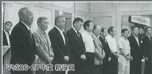
平成26・27年度 新役員