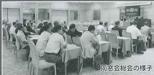
同窓会総会の様子