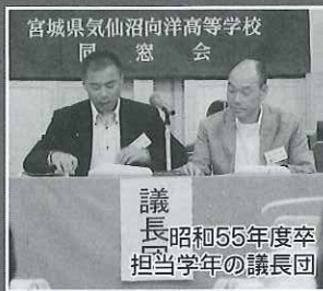
議長 昭和55年度卒 担当学年の議長団

7月19日(土)午後6時よりサンマリン気仙沼ホテル観洋にて、同窓生58名、来賓11名で総会及び懇親会が行われました。