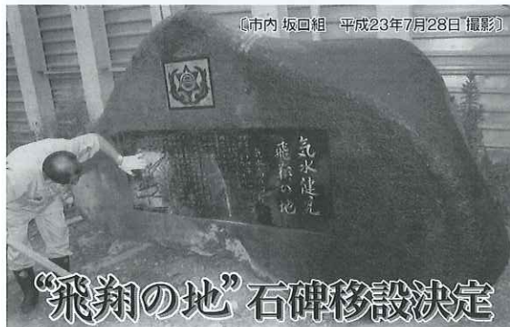
市内 坂口組 平成23年7月28日撮影

そして何よりも大津波で被災した我が母校、気仙沼向洋高校校舎移転建設事業が遅滞なく進められるように同窓会は、サポーターとして一致団結して取り組んでいかなければなりません。そのことが、後輩諸君への責任であります。