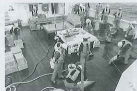
マクロ延縄実習(作業甲板での揚縄風景)

【資格取得】《本科》三級海技士(航海)筆記試験(科目合格)／第一級小型船舶操縦士／潜水士／危険物取扱者乙類4種／水産海洋技術検定／全商ビジネス文書実務検定3級／全商ビジネス文書実務検定3級速度部門／全商ビジネス文書実務検定3級文書部門／ 《専攻科漁業科》三級海技士(航海)筆記試験第1級海上特殊無線技士／船舶衛生管理者 【就職先】金気汽船(株)／共和水産(株)／日東水産(株)／(株)天洋／(株)新洋船舶 【進学先】富士大学経済学部経営法学科／東京理容専修学校／全国漁業協同組合学校