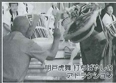
明戸虎舞 打ちばやしのアトラクション