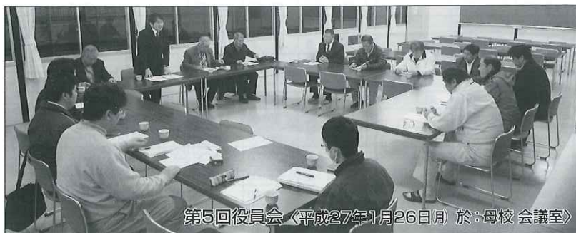
第5回役員会〈平成27年1月26日 於：母校 会議室〉

仮設校舎ゆえ、通常の高校生活では経験出来ない事など、それがこれからの生き方の源泉ともなる事でしょう。