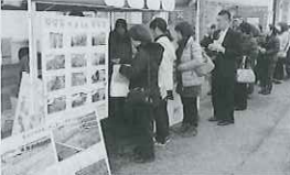
さんま缶詰販売実習風景(11月 大谷海岸道の駅)

繋がる・広がる、食品実習 今年度は、産業経済科3年生の全員が、一般の方を対象にした缶詰販売実習を経験しました。生徒達は、対面販売により地元を中心とした一般の方と交流する中で、食品製造の責任と意義について学びました。また、3年生の課題研究では継続して地元水産物の有効活用をテーマとした研究を行っています。中でも気仙沼の水産物を活用した食品を高校生が考案する企画「リアスフードを食卓に」プロジェクトに参加し、商品化が実現した作品もありました。今後は、食品の製造・管理・販売の知識や技術の向上に、新しいものを生み出せる力を養い、可能性の広がる人材を育成していきたいと思ひます。