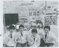
全国産業教育フェア(11月 岩沼市)

希望がかなう明日へ 地元の皆さんは元より、全国のみなさんからの心温まる物心両面からのご支援をいただき、毎日の教育活動が成り立っているものと大変感謝申し上げます。 それに報いるべく私たちは、生徒が安心して自学自習に打ち込み、彼等の成長をぬくもりを持って見守り続けること、環境作りを大切に仮設校舎での教育活動を続けております。 入学してくる生徒一人一人が将来に希望を持って日々の勉学に励み、その夢を叶えられ幸福感を持って卒業し、また、卒業生が自信を持って気仙沼に帰って来られる学校作りをしなければならぬと考えております。