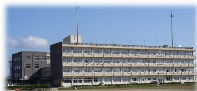
気仙沼水産高校・ 気仙沼向洋高校 階上校舎（波路上）