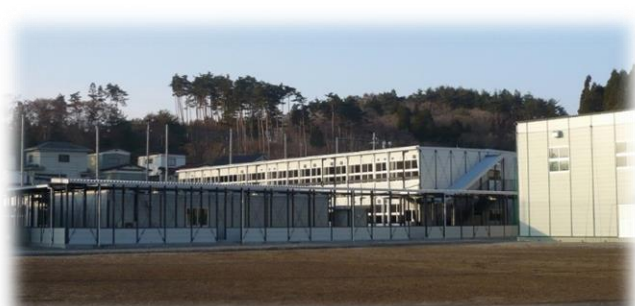
H23/11/5 H30/7 九条校舎 （気仙沼高校 第二運動場）