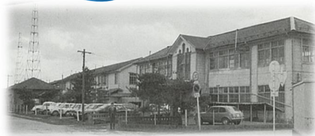
気仙沼水産高校 （景島校舎） （潮見町）