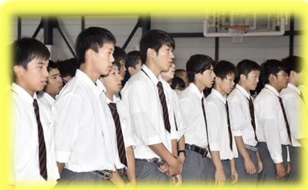
九条校舎最後の校歌斉唱