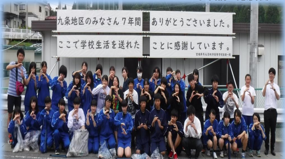
正門前で記念撮影！