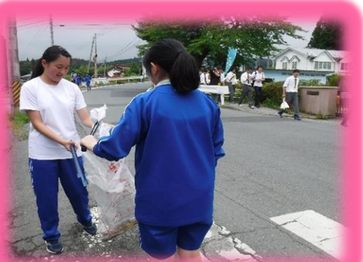
1年生は、気仙沼高校方面・大曲テニスコート方面・山中産業方面に分かれて、地域清掃を行いました。