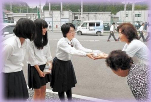
2、3年生は九条四区の方々へお礼のあいさつと、記念品の贈呈を行いました。