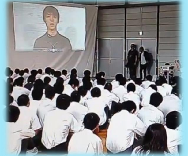
サプライズで、羽生結弦選手からメッセージを頂きました！！