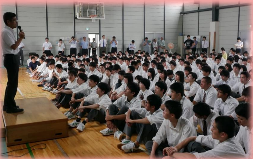
九条校舎閉校舎式

約7年間、私たち向洋生はこの九条校舎で授業や実習、部活動を行ってきました。私たちが震災後も変わらず学校生活を送れたのは九条地区のみなさんのおかげです。感謝の気持ちを込めて、地域清掃や近隣のお宅へ最後のあいさつを行いました。