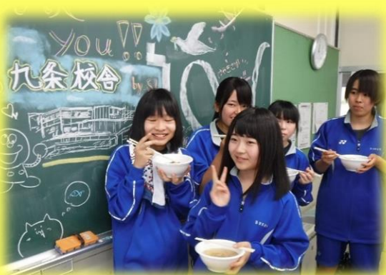
最後にみんなで産業経済科3年生が作った豚汁を頂きました！みんなで食べる豚汁はとってもおいしかったです。