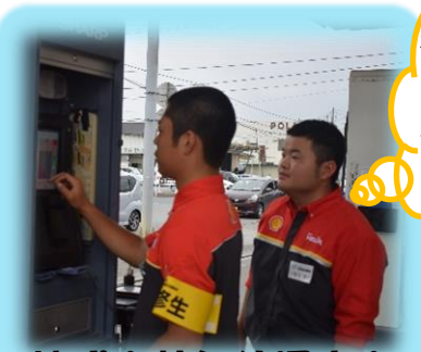
株式会社気仙沼商会