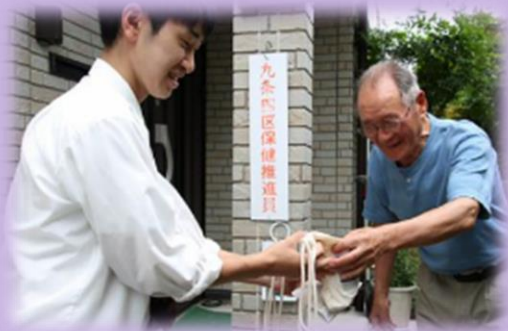
地域の方から「寂しくなるよ。向こうでも頑張って」とたくさんの方々から励ましの言葉を頂きました。