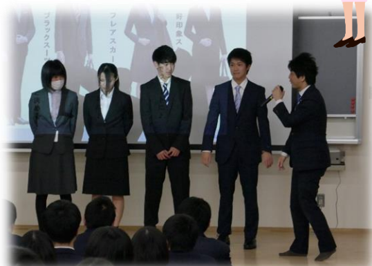
着こなしセミナー

3年生の登校日に、スーツの着こなしセミナーと入社準備セミナー、労働社会保険の講義が大講義室で行われました。着こなしセミナーでは、入学式や入社式に相応しいスーツの選び方や、礼服やコートの畳み方など詳しく説明していただきました。