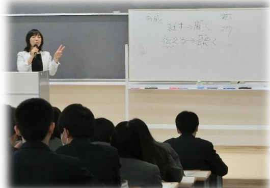
入社準備セミナー

3年生の登校日に、スーツの着こなしセミナーと入社準備セミナー、労働社会保険の講義が大講義室で行われました。着こなしセミナーでは、入学式や入社式に相応しいスーツの選び方や、礼服やコートの畳み方など詳しく説明していただきました。