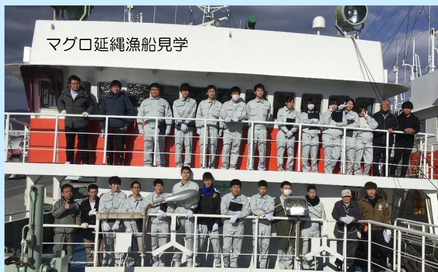
マグロ延縄漁船見学