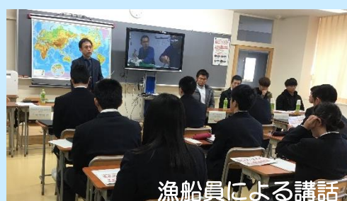
漁船員による講話